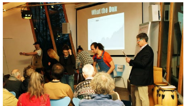
Szenische Inszenierung am Lernort: „Leben im Hamsterrad“

Am ausgeprägtesten findet sich dieser Ansatz sicher in der Idee der Sozialkunst . Sie gestaltet das soziale Leben, die zwischenmenschlichen Zusammenhänge oder wirkt zumindest auf diese gestaltend ein. Sozialkunst ist der bewusste Umgang der Menschen miteinander und das Gestalten sogenannter „sozialer Räume und Prozesse“. Das geht ohne spezielle Medien, nur mit dem Menschen selbst, also mit den Menschen für die Menschen. Ziel ist es, damit die authentische, verantwortliche Selbstbestimmung der Menschen in ihrer Gemeinschaft zu erreichen. Soziale Kunst zeigt mir, wie ich mir selbst und dem Anderen in dieser Entwicklung zu mehr Freiheit helfen kann. Das geht, wenn ich den anderen Menschen und die Welt in ihrem Wesen erfasse. Sozialkunst macht das unter anderem, indem sie echte Begegnungen ermöglicht, dadurch dass sie mehr oder weniger unkonventionelle, Routinen brechende Rahmenbedingungen setzt. Dadurch lässt sich – wie weiter oben im Zusammenhang mit der Stärkung der psychischen Ressourcen dargestellt – die Wahrnehmung des eigenen Selbst, die der anderen Menschen und der gesamten Mitwelt vertiefen und auch auf die „Zwischenräume“ richten. Um das zu veranschaulichen, ist ein Workshop von Oliver Sachs, Andreas Poggel und Heike Pourian (2017) zu nennen mit Betrachtungen zu Michael Endes Momo, Übungen in Gewaltfreier Kommunikation und Kontaktimprovisation.