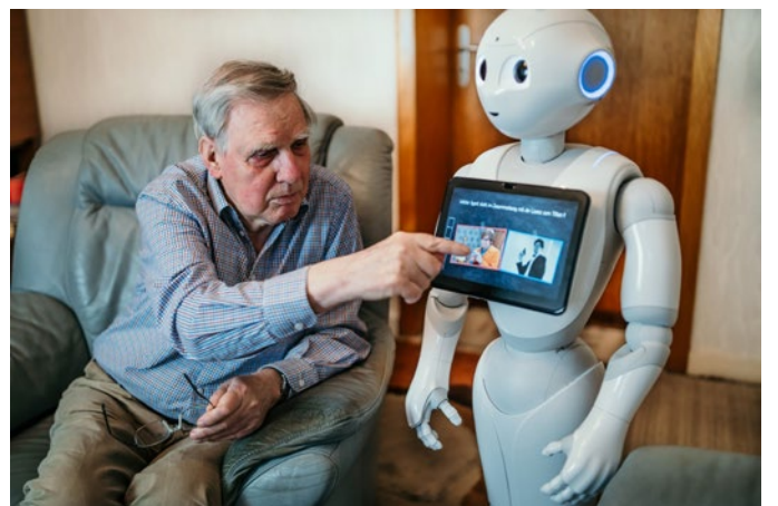
Wo ist der Einsatz von Robotern wirklich sinnvoll und welche Bedingungen setzen dafür den Rahmen?