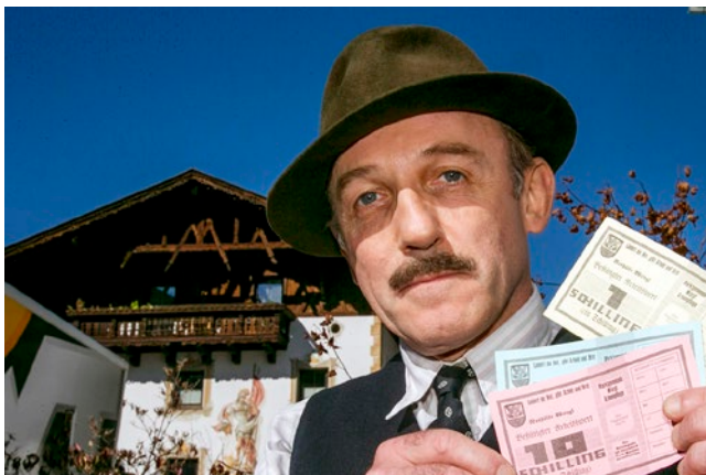
Karl Markovics als Unterguggenberger in „Der Geldmacher“

Immer wieder fragen sich Freiwirtschaftlerinnen und Freiwirtschaftler, welche von Gesells Ideen im Lauf der letzten hundert Jahre umgesetzt wurden. An verschiedenen Stellen finden sich empirische Belege für die Wirkung Gesellscher und anderer Reformansätze. Es muss auch nicht immer eine tatsächliche verwandtschaftliche Verbindung zu Gesells Ideen geben. Einige reale Vorhaben und Entwicklungen wie Währungsexperimente mit Umlaufsicherung, ausgehend von dem Experiment in Wörgl/Tirol sind zu nennen (s. a. Onken 1997 ). Außerdem gibt es Projekte, die auf Quartiersebene erwirtschaftete Bodenrenten in das Gemeinwesen rückverteilen (z. B. Netzwerk Immobilien). Die Aufmerksamkeit einer interessierten (Fach-)Öffentlichkeit für die vorhandenen oder auch früheren Praktiken ließe sich verstärken. Ihre Wirkungsweise wie auch ihre Übertragbarkeit wären zu analysieren und die Möglichkeit zur Ausweitung zu untersuchen.